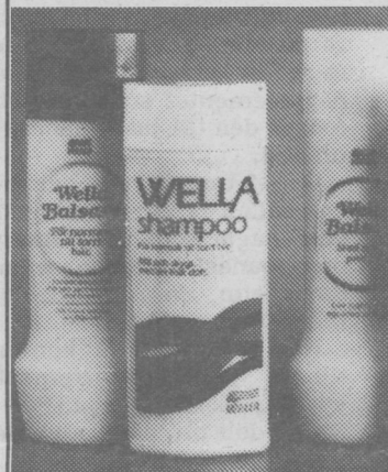
Wella Balsam 200 ml . . . . . (2