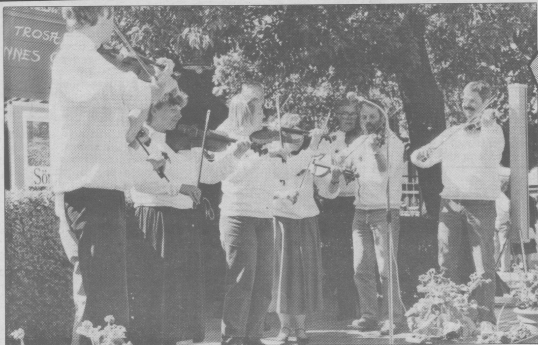
Lästringe Låtar tillhörde dem som deltog i spelmansstämman.