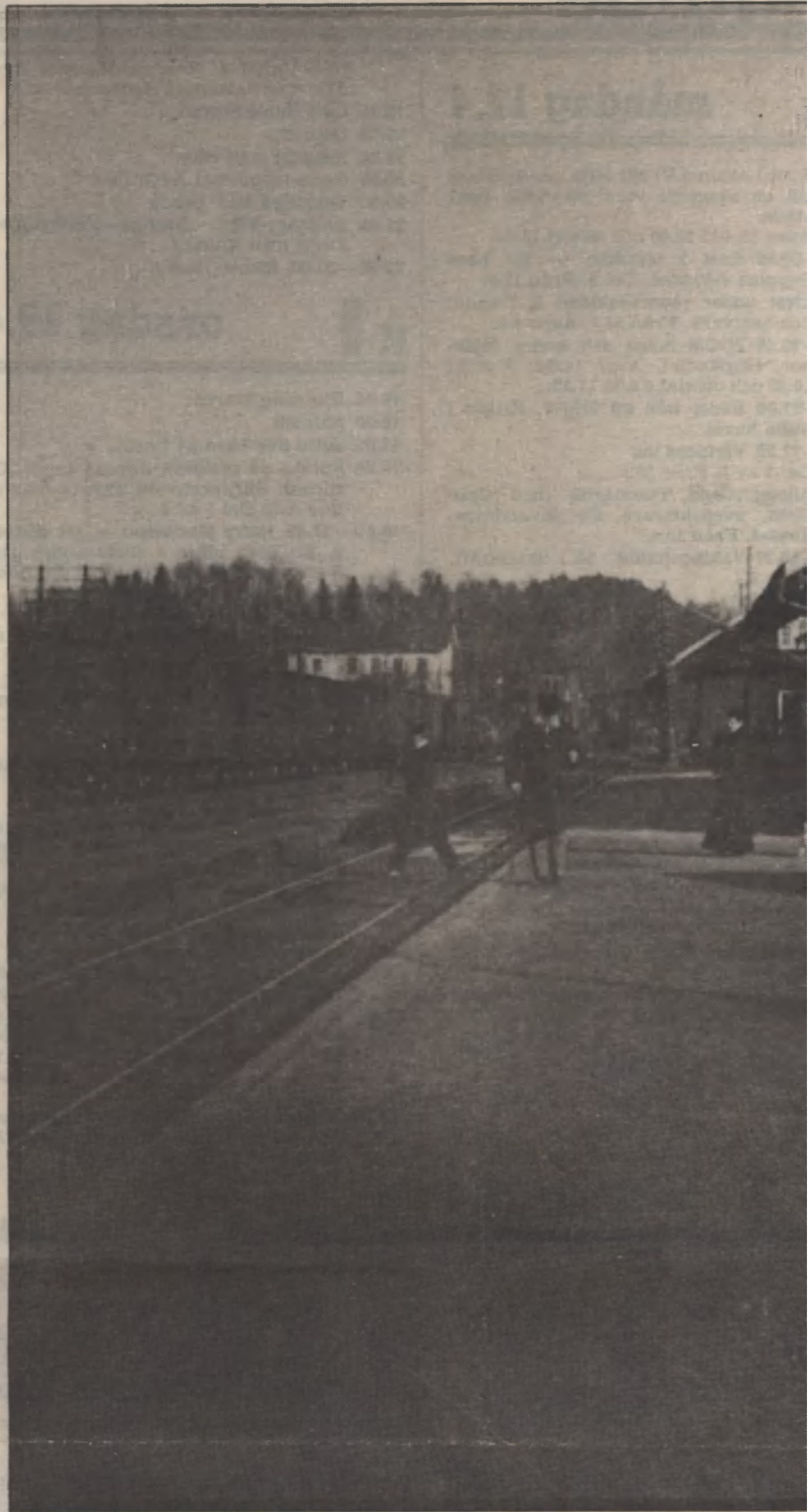
Så här såg det första stationshuset i Gnesta ut. Det kom att stå modell för många omkring sekelskiftet.

Stationshuset blev centrum i det nya samhället och hit flyttade rallare och stationspersonal och med dem följde hantverkare och köpmän. I början av seklet tjänstgjorde 60 personer på järnvägsstationen — stationskarlar och trafik- och maskinpersonal. Samhället växte fort och man trodde att det så småningom skulle bli en hel stad.