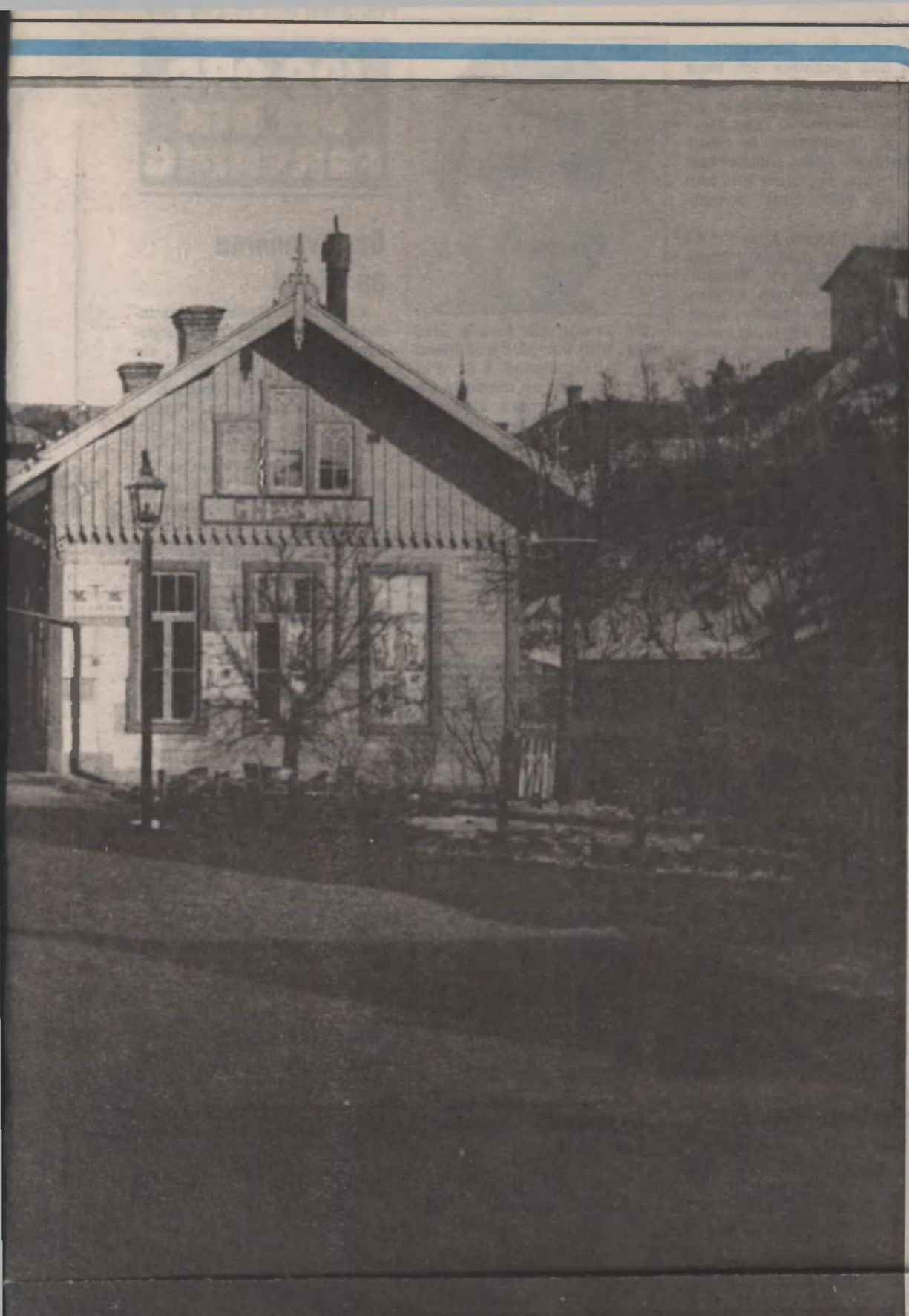
Byggnader i landet. Bilden är tagen

la vat- är det nhället skt ut- i höjd- cka le- not den hunnit gen är r kom- förråd rycker är det tt stilla m vem