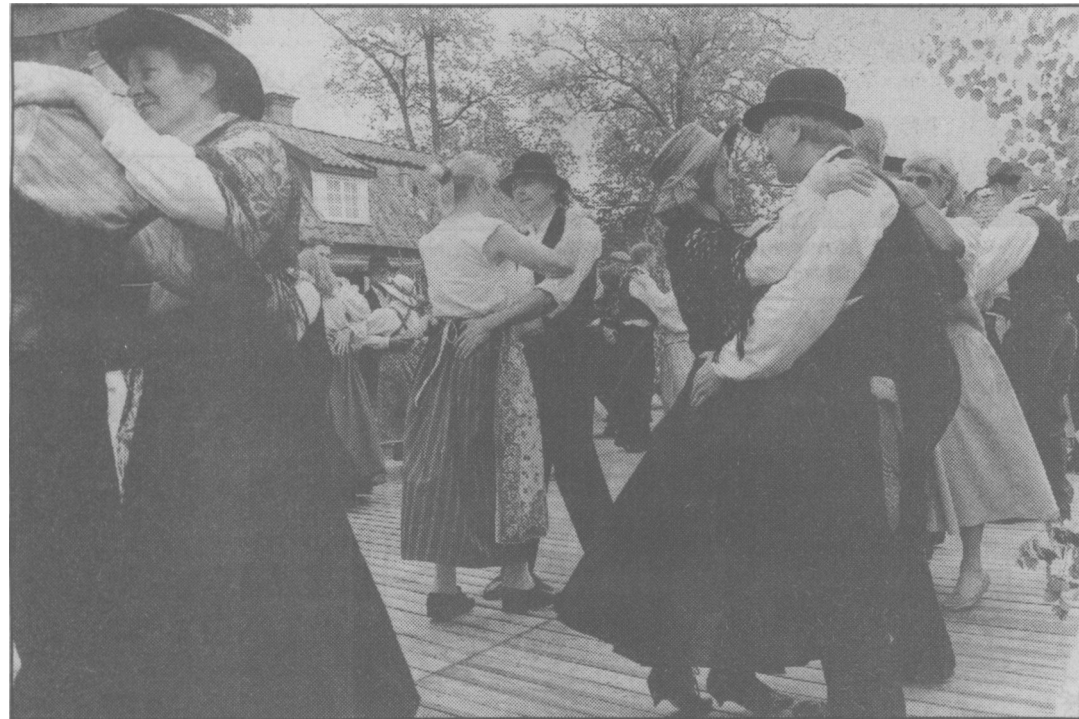
VM i gubbstöt i Malmköping lockar dansande från när och fjärran och stilarna varierar som synes.

kort kom som vanligt till flitig användning, medan överdomaren själv herr Olsson villigt tog emot muta efter muta.