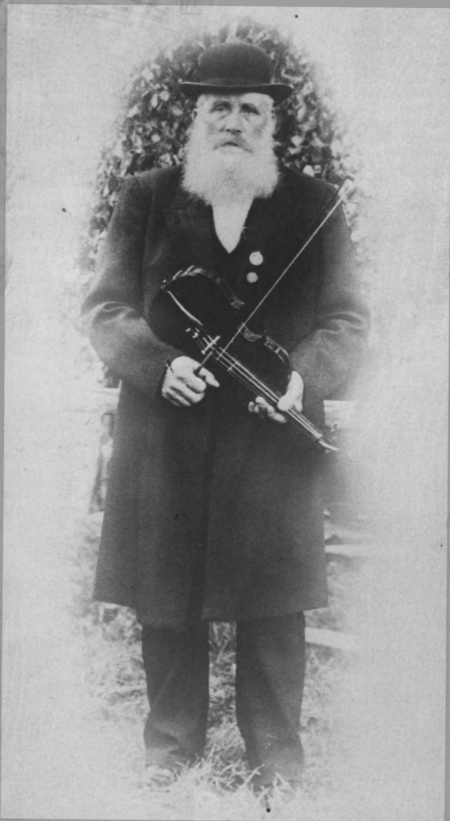
Den här typiske spelmannen från sekelskiftets spelmansstämmor får symbolisera Kringelleken, rikspelmansstämman i Södertälje den 11-17 juni.

Information om Södertälje kommun 2/73 Maj