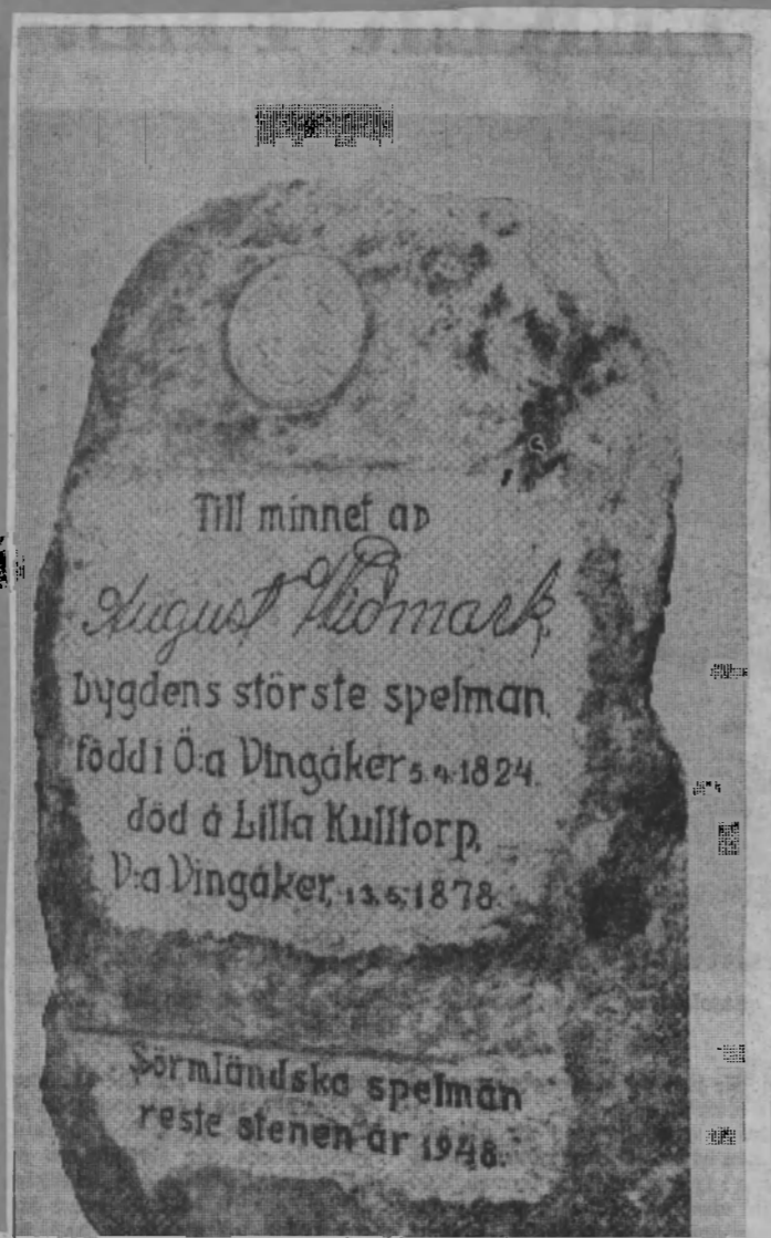
Minnesstenen över August Widmark, "bygdens störste spelman", restes av sörmländska spelarna 1948.