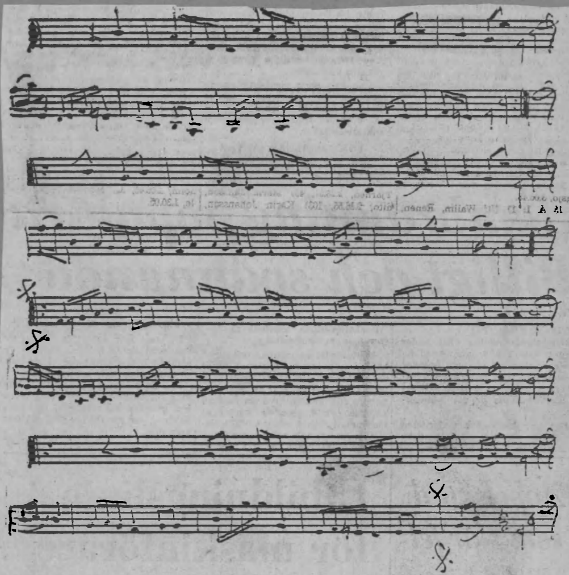
Kadrilj ur Aug. Widmark d. ä:s notbok. En typisk "herrskapsdans" med ursprung från 1700-talets kontradanser.