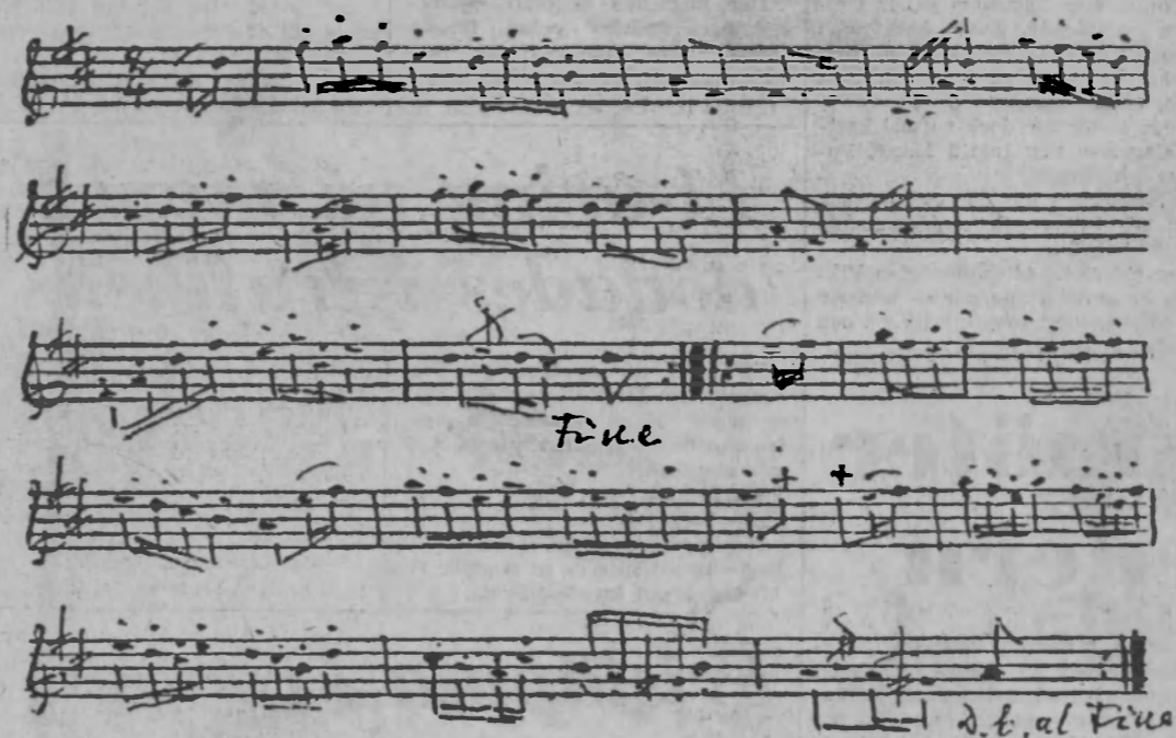
En hornpipe, en solodans för starka karlar. Ur Aug. Widmark d. y:s notbok.